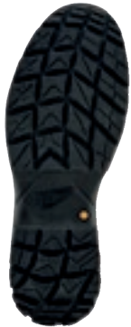
Mini Lug RBR