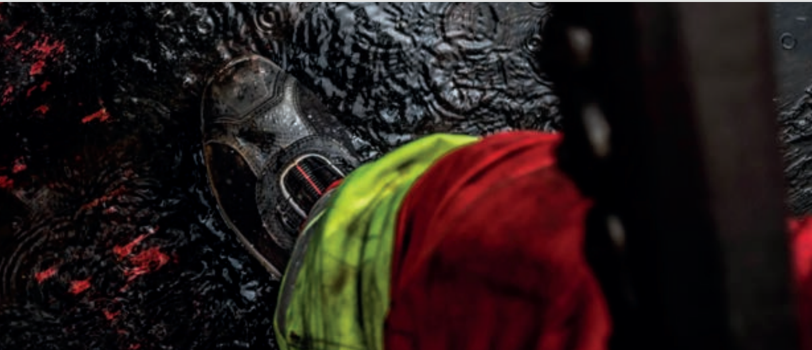
Suela Chevron SuperSole